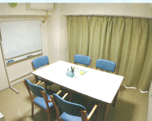
小集団セラピールーム