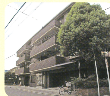
三国丘こころのケアセンター (病院隣地)