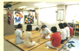
作業療法での茶道

作業療法(入院・外来)、生活技能訓練(入院)、精神科デイケア(外来)、退院前訪問指導、訪問看護指導などの精神科リハビリテーションに取り組んでいます。医師、看護師、作業療法士、精神保健福祉士、臨床心理士といった多職種が協同して行なっています。