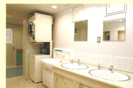
洗面所・ランドリー