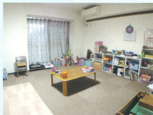
子ども専用のプレイルーム