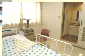
特別個室(バス・トイレ付)