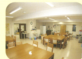
大規模デイケア「けやき」